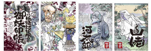
御妖印帳 表紙、裏表紙 (イメージ)

スマホに現れた妖怪を封印!! 御妖印を 10 種集めて「御妖印帳」を Get しよう。